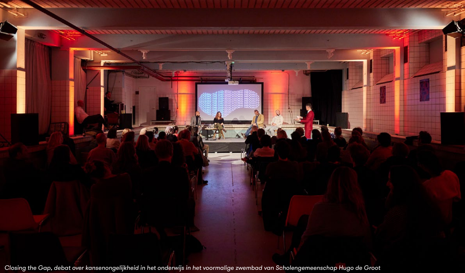
Closing the Gap, debat over kansenongelijkheid in het onderwijs in het voormalige zwembad van Scholengemeenschap Hugo de Groot