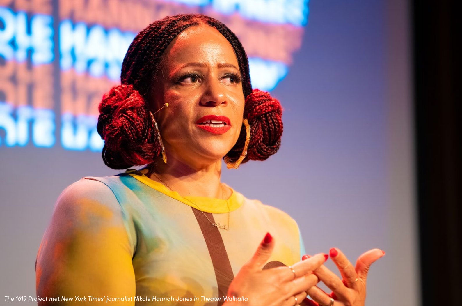
The 1619 Project met New York Times' journalist Nikole Hannah-Jones in Theater Walhalla

vacatureteksten, werving via formele kanalen (i.p.v. informele netwerken), en het toepassen van de 'Rooney Rule' die stelt dat voor elke vacante functie minstens één kandidaat met een bi-culturele achtergrond voor een sollicitatiegesprek wordt uitgenodigd. Voor het verder vormgeven van dit proces hebben we eind 2023 het initiatief genomen om ons aan te sluiten bij 010Inclusief: het SER-programma over diversiteit op de werkvloer.